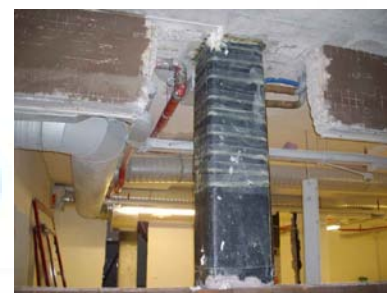
Installazione di sistema di monitoraggio innovativo mediante applicazione di fibre ottiche.

Sede legale FIDIA S.r.l. Via Gerardo Dottori, n.85 06132 S. Sisto PERUGIA Tel.+39-075-5271550 - Fax.+39-075-5298077 Part. IVA 02140130549 C.C.I.A.A. 181644 Iscr. Trib. PG 28053