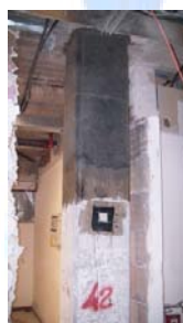
Esecuzione di indagini sperimentali a seguito dell'intervento di rinforzo. Pull-off per verificarne la corretta applicazione