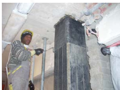
Fasciatura del pilastro mediante tessuti in fibra di carbonio opportunamente impregnati in situ.