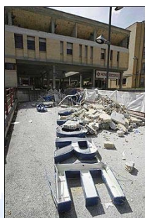
Facciata del pronto soccorso dell'ospedale San Salvatore a L'Aquila.