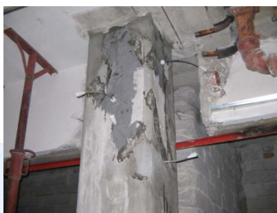
Cannule per l'iniezione delle fessurazioni mediante resine epossidiche fluide.