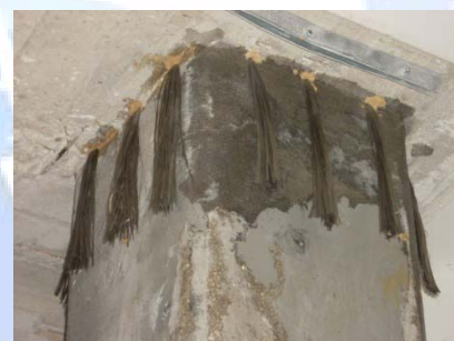
Perforazione per l'inserimento di barre a fiocco FIDBASALT CONNECTOR MONO-THREAD.