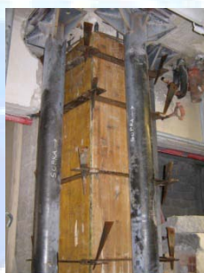
Ripristino della staffatura del pilastro e successivo getto di calcestruzzo.