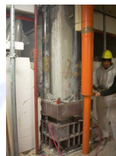
Messa in sicurezza e scarico del pilastro soggetto a scarnificazione, mediante martinetti idraulici.